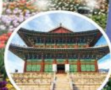
พระราชวังเคียงบกุง (Gyeongbokgung Palace)