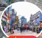
ย่านฮงแด (HONGDAE)