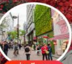
ย่านเมียงดง (MYEONG-DONG)